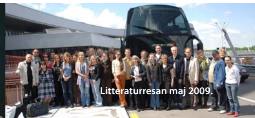
Litteraturresan maj 2009.